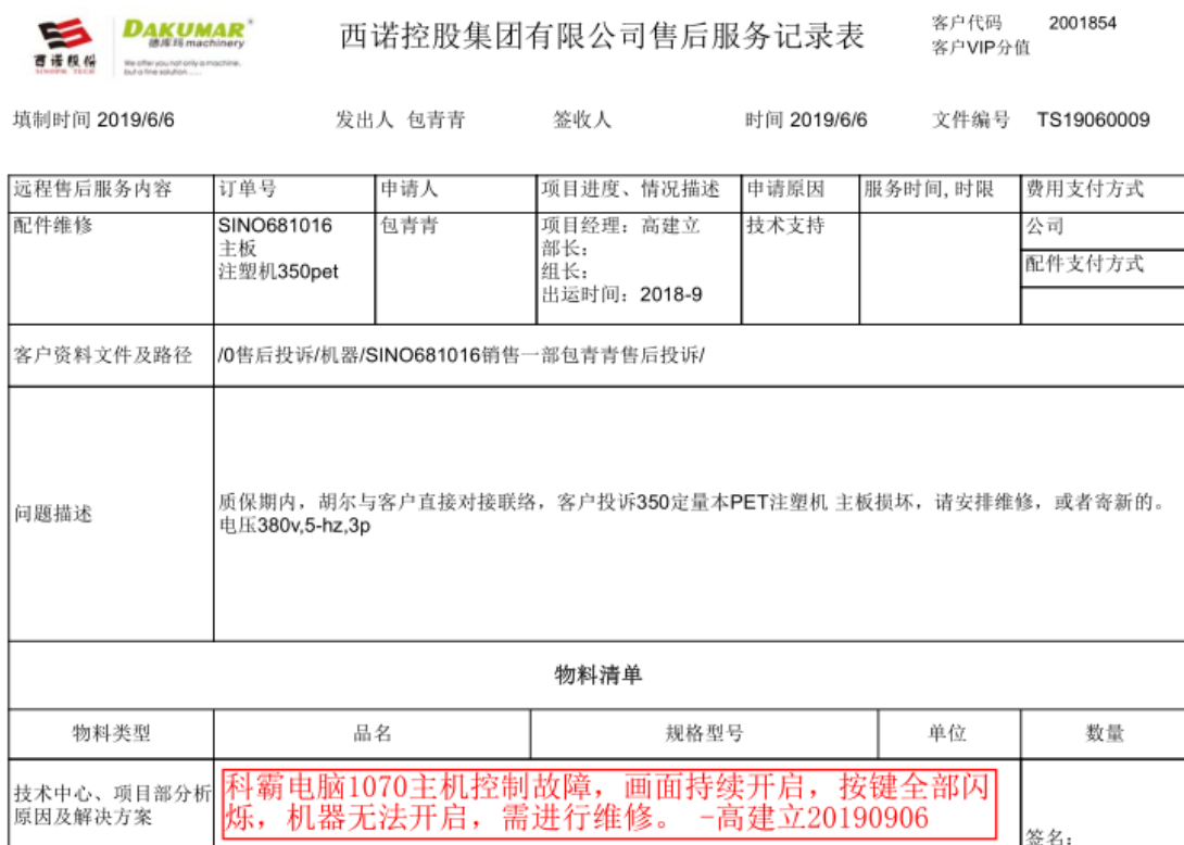
图 6.1-01 注塑机售后服务记录

专职售后服务人员的指派需本着就近、顺道、技能配合和人员统一调配的原则。具体售后服务见下图所示：