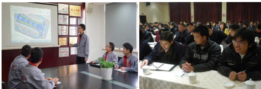
图 3.2-1 各类培训活动

公司将员工学习和发展视为“投资”，把创建学习型组织，营造全员学习的氛围作为公司长期发展战略的重要组成部分。随着公司规模扩大和全球化发展战略的实施，根据企业相关规定及各部门要求确定培训人员的需求情况。各部门负责人确定人员培训需求后经公司领导审批，相关部门每季度根据人员数量酌情进行培训计划的制定与实施。公司并成立了“西诺商学院”，见图 3.2-1 所示。