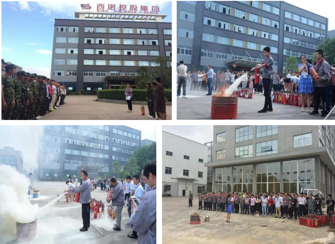
图 6.3-01 2018 年火灾应急演练记录

公司每年举行消防演练和各种灾害应急演练。公司制订了《配电房火灾、爆炸应急预案》等应急预案、《触电事件应急预案》、《重大设备故障应急预案》等应急处置方案等，对火灾、机械、触电等均有相应的应急措施，并成立了应急指挥中心和应急救援专业组。